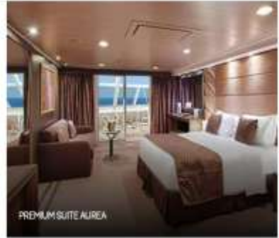
PREMIUM SUITE AUREA