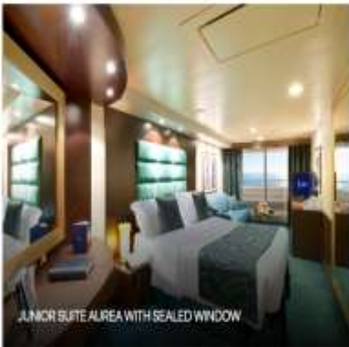
JUNIOR SUITE AUREA WITH SEALED WINDOW