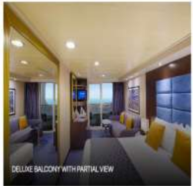
DELUXE BALCONY WITH PARTIAL VIEW