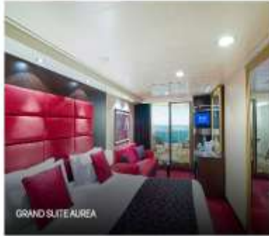
GRAND SUITE AUREA