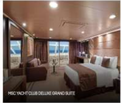
MSC YACHT CLUB DELUXE GRAND SUITE