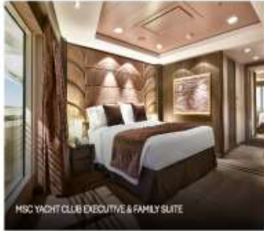
MSC YACHT CLUB EXECUTIVE & FAMILY SUITE