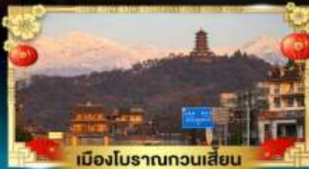
เมืองโบราณกวนเสียน