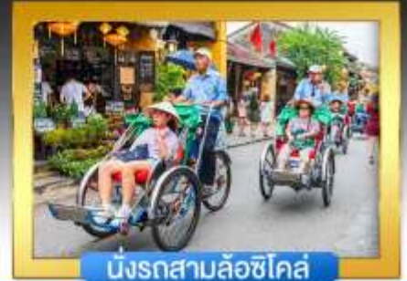
นั่งรถสามล้อซีโคล์