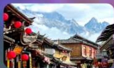
เมืองโบราณซาซี