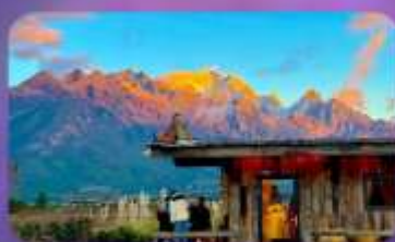
คาเฟ่ Yun Ti Yang