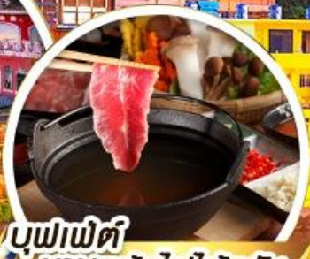
บุฟเฟ่ต์ ซาบูทมิ้อไฟโตทวัน