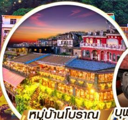
หมู่บ้านโบราณ จิวเฟิน