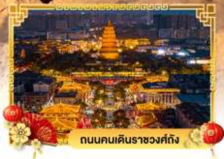
ถนนคนเดินราชวงศ์ถัง

เดินทางโดย: สายการบินสปริงส์แอร์ไลน์ (9C)