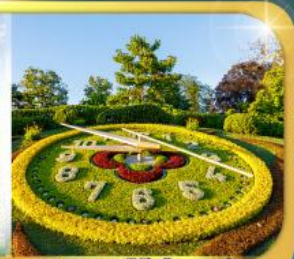
นาฬิกาดอกไม้เมืองเมริงเงา