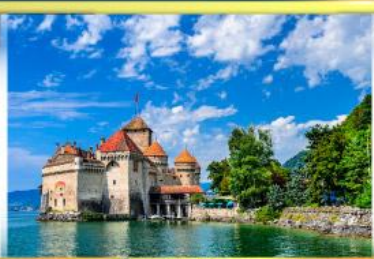
ปราสาทชิลยง