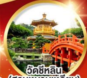
วัดซีหลิน (สวนหนานเหลียน)

ขอพรโชคลาก ความมั่งคั่ง ขอพรความสำเร็จ การงาน ขอพรความสำเร็จในชีวิตการงาน ขอพรเรื่องเงิน ความร่ำรวย ขอพรให้ชีวิตราบรื่น