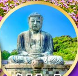
วัดโคโตคุอิน