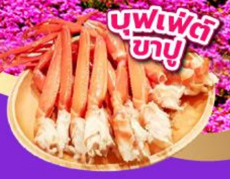
บุฟเฟ่ต์ ภูเขา