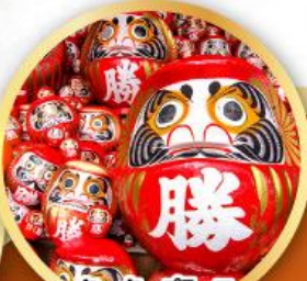
วัดคัตสึโองิ (วัดดาร์มะ)

ชมความงามของกำแพงหิมะ เส้นทางสายอัลไพน์ ทากายามา (JAPAN ALPS SNOW WALL)