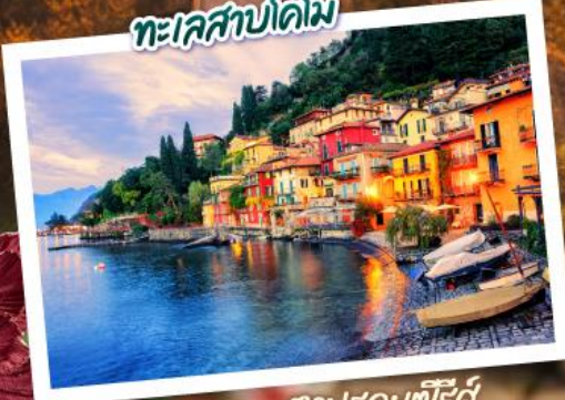
ตามรอยซีรีส์