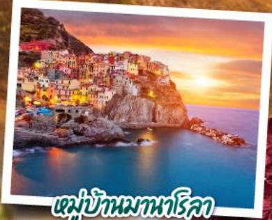
หมู่บ้านมานาโรลา