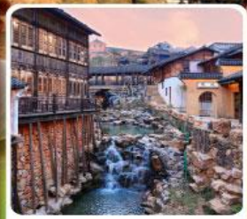
เมืองโบราณเหยาหู