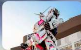
ช้อปปิงโอไดบะ