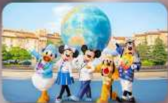
อิสระตามอียิปต์ 2 วัน

HOTEL ASIA NARITA ห้องเตียงสามมาตรฐานคู่เตียง