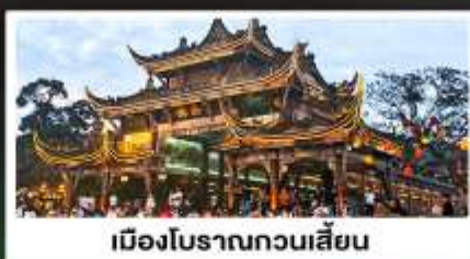
เมืองโบราณทวนเสียน