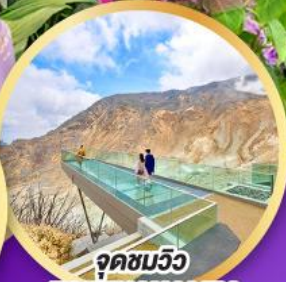
จุดชมวิวก EARTH VALLEY