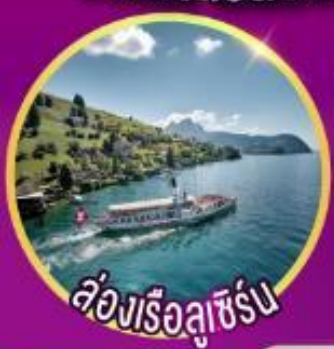
เรือลูซิเิร์น