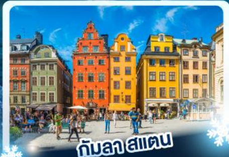
กับลาสแตน