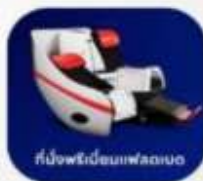
ที่นั่งพริ้นแบบฟลัดดิง