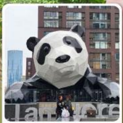
แพนด้าปิ่นตึก IFS