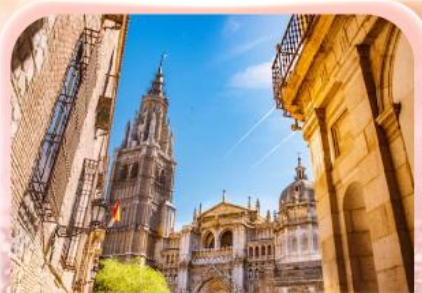
มหาวิหารแห่งโกเอลดา

ซาคราเดา ที่ว่ายิ่งใหญ่ ยังไม่เท่าใจ... ที่ให้เธอไปหมดแล้ว