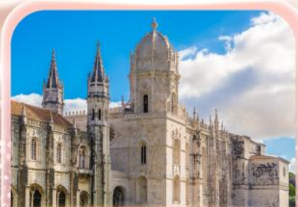
มหาวิหารเจอรานิโม