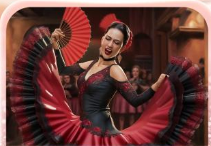
ระบำฟลามิงโก